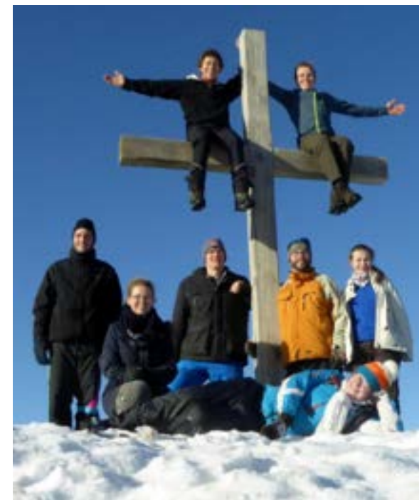
Winterhütte in Hagspiel im Allgäu